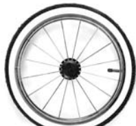
KOŁO 14" MS CHROM