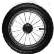
KOŁO MS CHROM